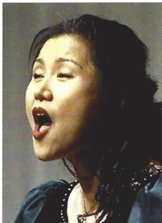
Haeyoung Shin Sopran